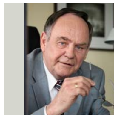
Prof. Dr. Wolfgang Böhmer Minister-President of the State of Saxony-Anhalt